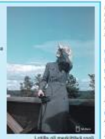
Leifin ja neuvottelijan ilmapuolustuksessa.

Ilmajoukkoyksienin näyttelyt ovat esillä Digimuseossa helmikuun alusta 2024 alkuun.