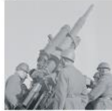
Sotahetken il-patteri helmikuussa 1944.

Tapahtuma strimataan osoitteella https://bit.ly/suurpommitukset1944 Sanomatalon Mediatori (Töölölehdenkatu 2) klo 17