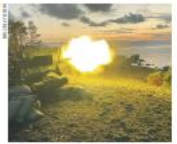
22 minn Ilmajoukkoyksienin Sarjan avaus. Karttansa näyttävä Veijerivuoressa.