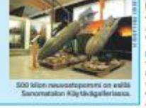
500 miljoonaa neuvottelijan esillä Sanomatalon Käytävällä.

Tapahtumien lisätiedot löydät verkosta sotiemmeperinne.fi